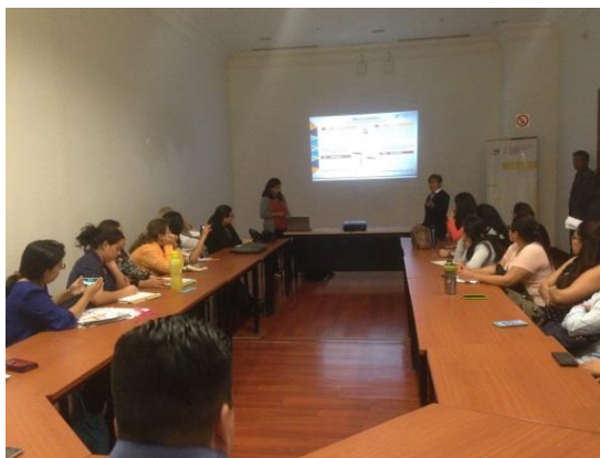
Fotografía 6. Taller de Sigad