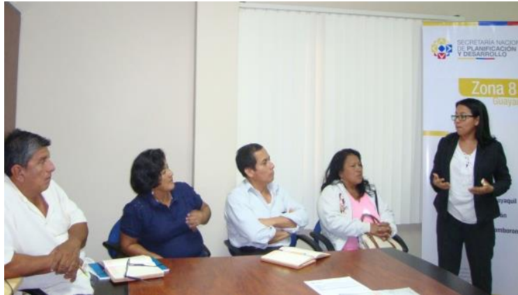
Fotografía 1. Fortalecimiento de las capacidades de los GAD