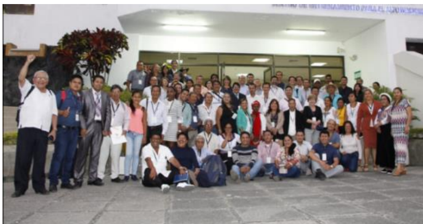
Fotografía 2. X Asamblea Ciudadana Plurinacional e Intercultural para el Buen Vivir