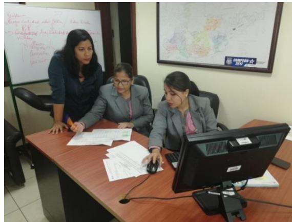
Fotografía 4. Asistencia técnica a funcionarios del Ejecutivo