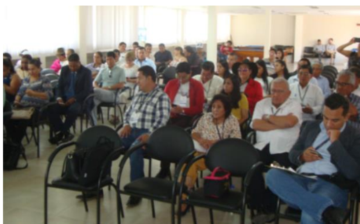
Fotografía 3. XI Asamblea Ciudadana Plurinacional e Intercultural para el Buen Vivir