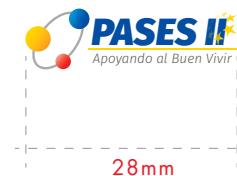
Uso offset versión especial para tamaños pequeños 28mm