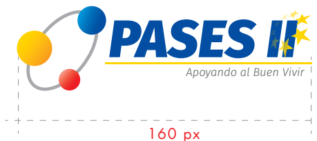
Uso digital 160 px