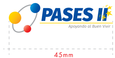
Uso offset 45mm