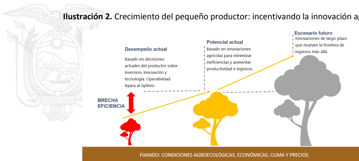
Ilustración 2. Crecimiento del pequeño productor: incentivando la innovación agrícola

Este análisis considera condiciones agroecológicas y económicas locales en una microrregión que afectan a la producción agrícola.