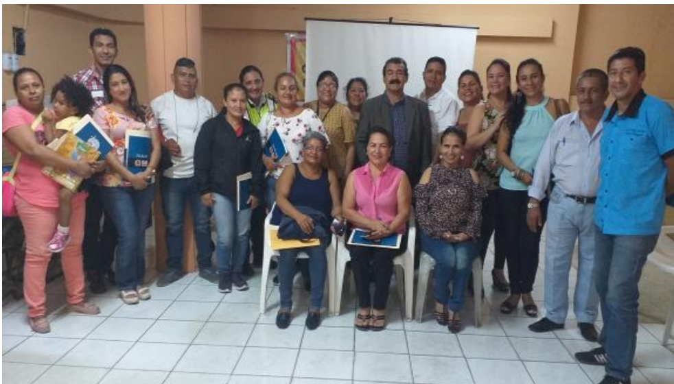
Ilustración 4. Capacitación a Asamblea Local