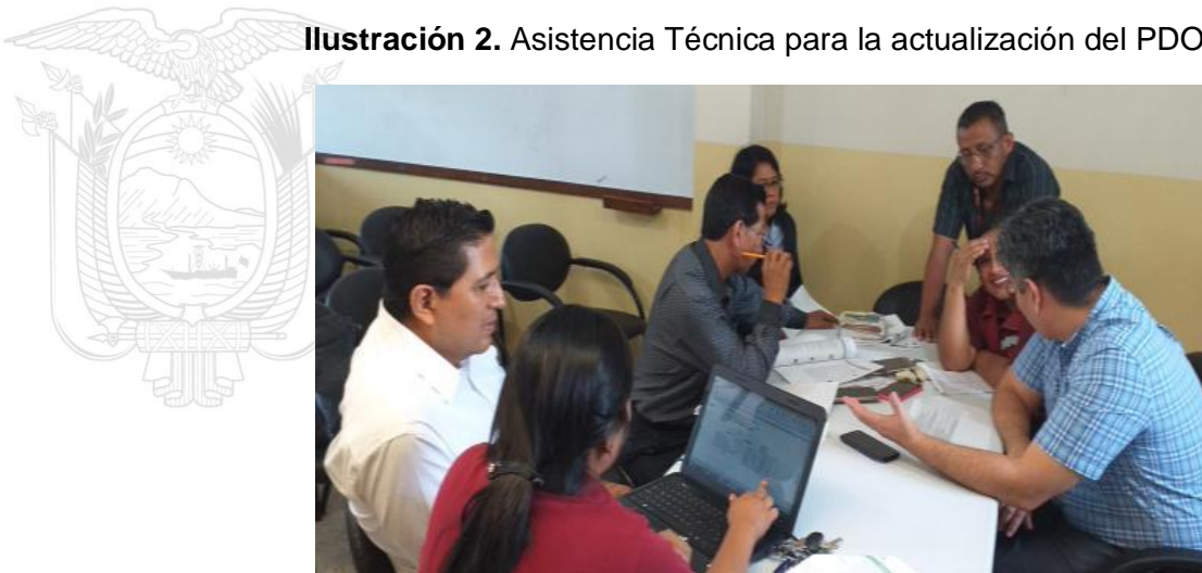
Ilustración 2. Asistencia Técnica para la actualización del PDOT