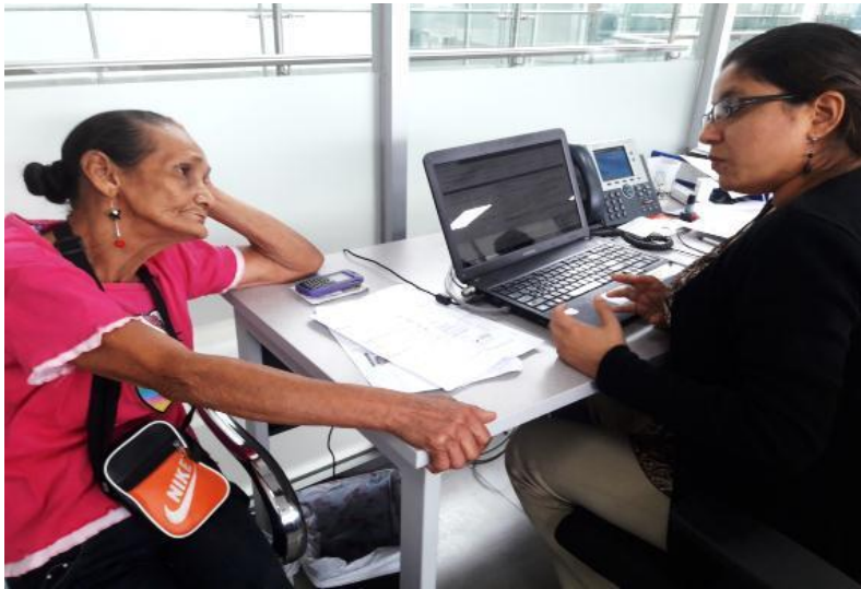
Ilustración 5. Atención a usuarios para el Registro social