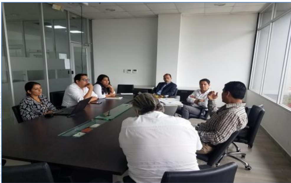
Ilustración 8. Mesa de Trabajo con representantes de Secob y Mineduc