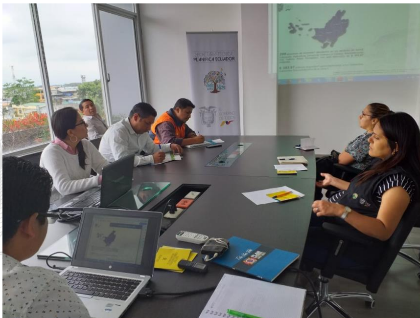
Ilustración 3. Asistencias técnicas en SIPeIP