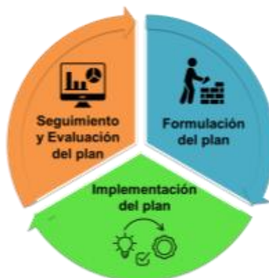
Ilustración 1. Ciclo de Planificación