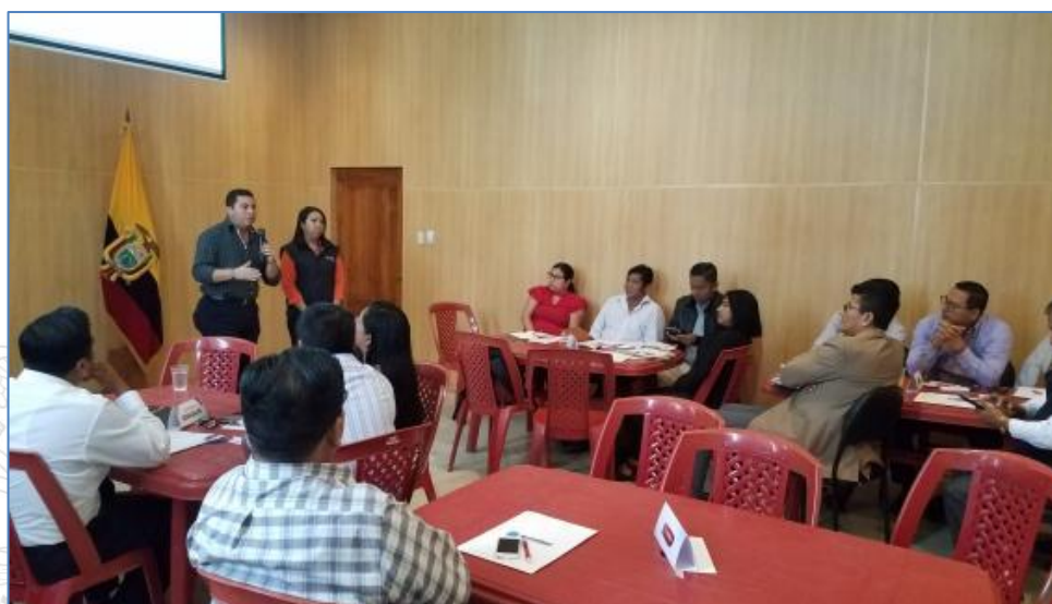
Ilustración 7. Taller sobre elaboración de Proyectos