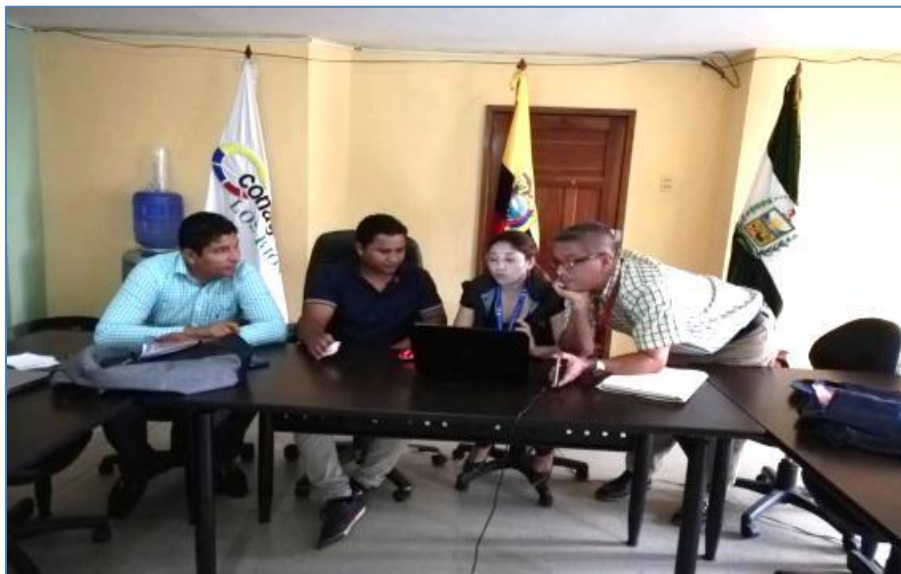
Ilustración 6. Asistencia técnica en el territorio