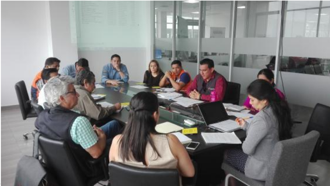
Ilustración 9. Desarrollo de la Mesa Técnica de Trabajo Sector Hábitat y Vivienda