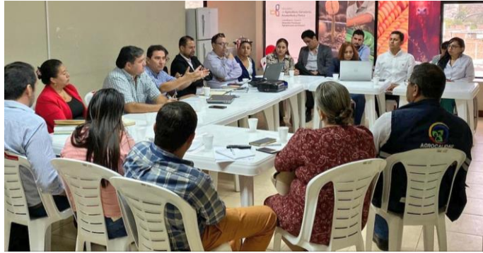
Ilustración 2. Difusión de lineamientos PDOT

Fuente: Coordinación Zonal de Planificación 4 - Pacífico. Elaboración: Coordinación Zonal de Planificación 4 - Pacífico.