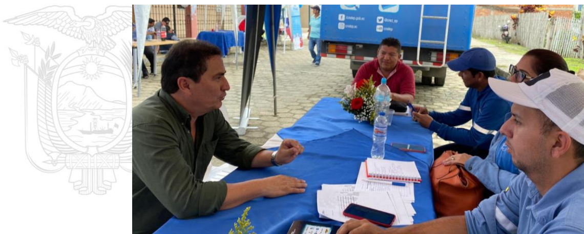
Ilustración 1. Asistencia técnica de la Secretaría Técnica de Planificación