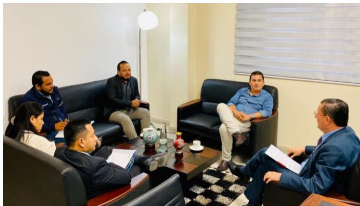
Ilustración 3. Reuniones de coordinación para lograr alianzas estratégicas

Fuente: Coordinación Zonal de Planificación 4 - Pacífico. Elaboración: Coordinación Zonal de Planificación 4 - Pacífico.