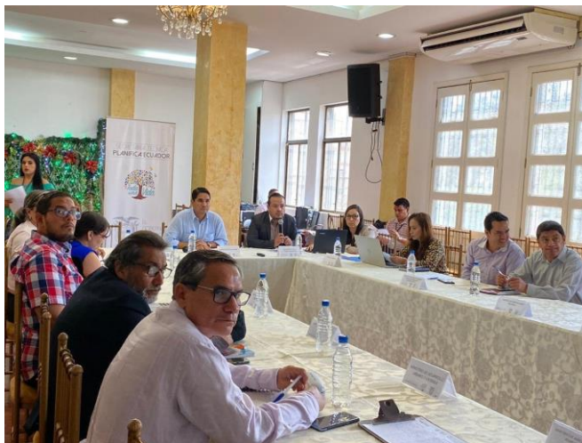
Ilustración 8. Reunión Mesa Técnica de Seguimiento de Obras en Manabí