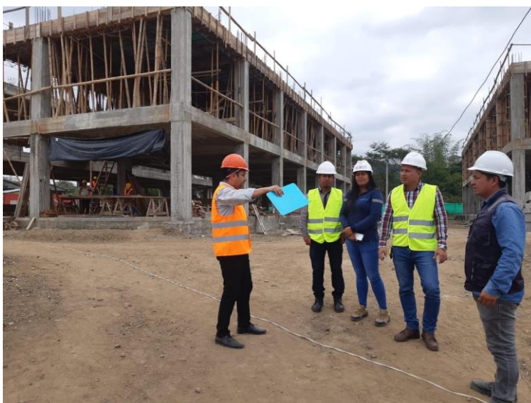
Ilustración 5. Seguimiento y reporte de alertas en territorio