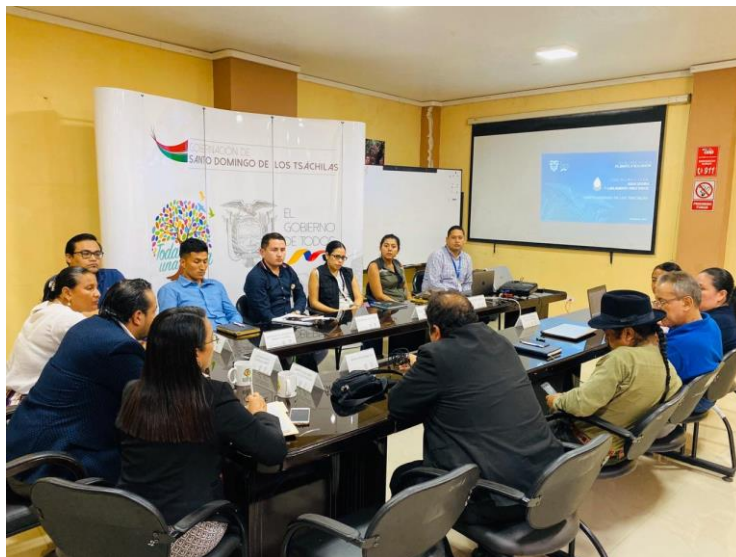
Ilustración 7. Reunión Mesa Técnica del Comité zonal Santo Domingo de los Tsáchilas