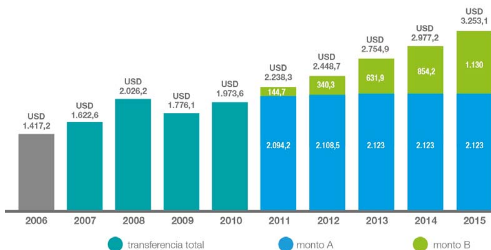
Ilustración 6: Transferencias a los GAD (montos en millones de dólares)

Nota 1: Valores en millones de dólares en 2007. Datos provisionales a partir de 2009.