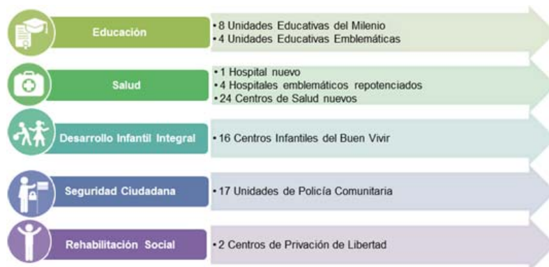
Ilustración 5: Número de unidades prestadoras de servicios construidas y repotenciadas en el año 2015