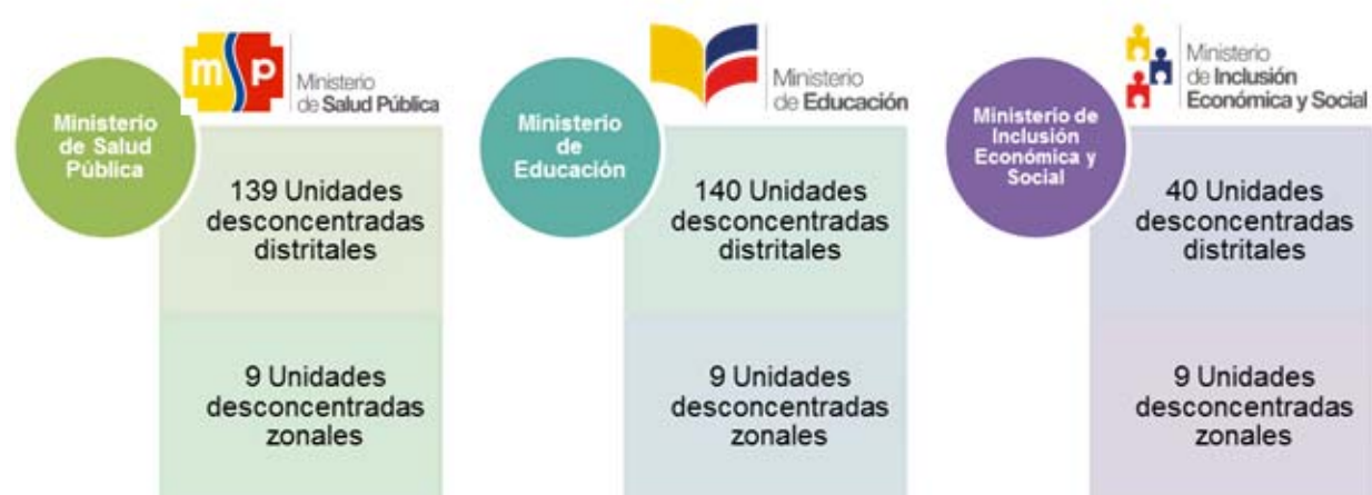
Ilustración 4: Detalle de las estructuras desconcentradas