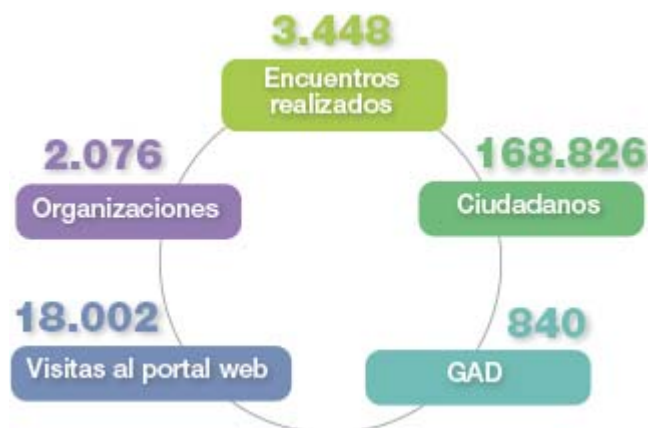
Ilustración 7: Datos globales de participación del Diálogo por la Equidad y la Justicia Social (Corte al 22 de octubre de 2015)