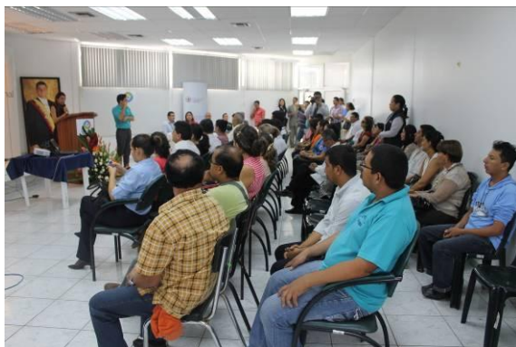
Ilustración 8: Presentación PNBV en braille y audio-video con lenguaje de señas