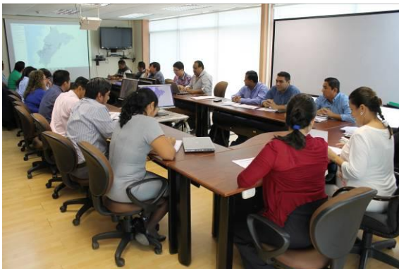
Ilustración 1: Reunión con los integrantes de la mesa de trabajo técnica 8 del COE