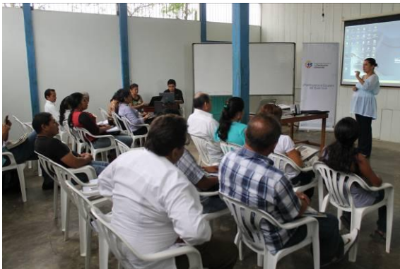
Ilustración 12: Taller de formación ciudadana en Transformación del Estado