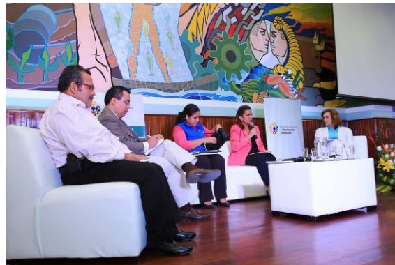
Ilustración 14: Evento Gabinete Ciudadano, realizado en el cantón Portoviejo