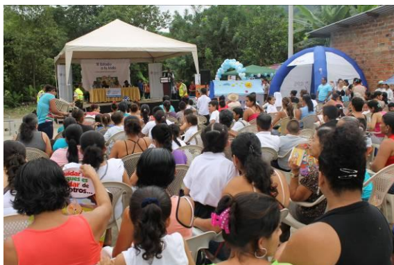
Ilustración 11: Feria Ciudadana en el sitio Miguelillo del cantón Portoviejo