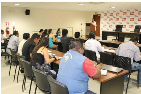
Ilustración 3: Taller de acompañamiento a los GAD de la Zona 4