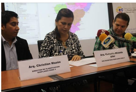
Ilustración 2: Firma del compromiso interinstitucional con el IESS