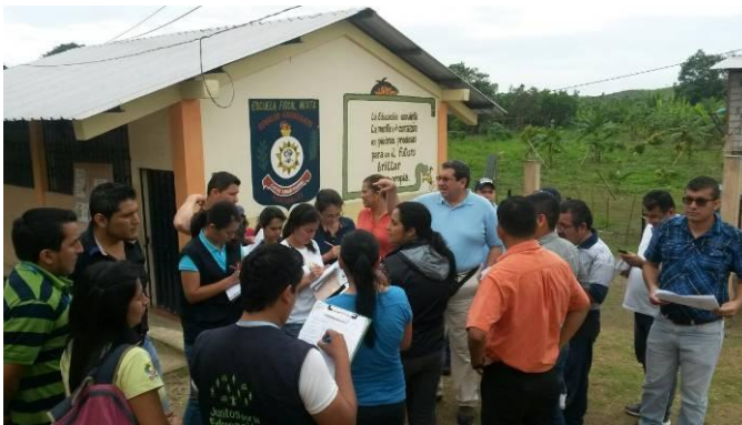
Ilustración 9: Recorrido de seguimiento al proceso de desconcentración