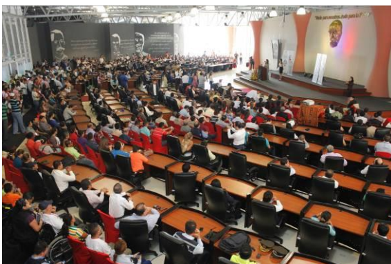
Ilustración 15: Evento Diálogo Territorial por la Equidad y la Justicia Social