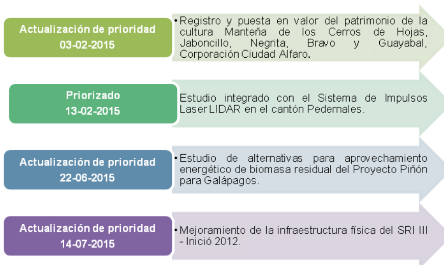
Ilustración 6: Proyectos priorizados durante el 2015 en la Zona 4