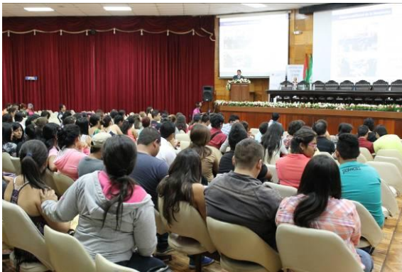
Ilustración 4: Evento de socialización de la Agenda Zonal 4