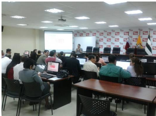
Ilustración 7: Taller de acompañamiento a los GAD sobre metodología del ICM